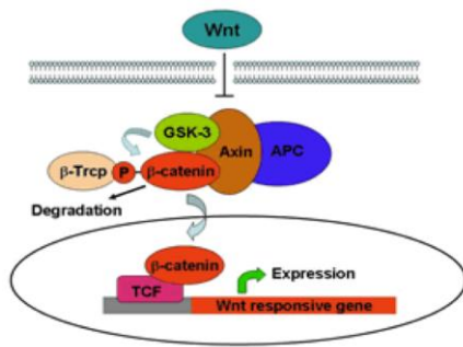
図1) Wnt/β-cateninシグナル伝達系

り、神経突起の伸長など神経形成に関わることも示されています。脳では、胎生期から新生児期にかけて